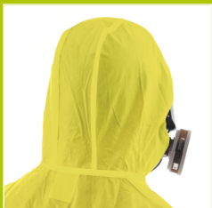
Capucha de 3 piezas