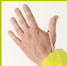
Sujetador de manga